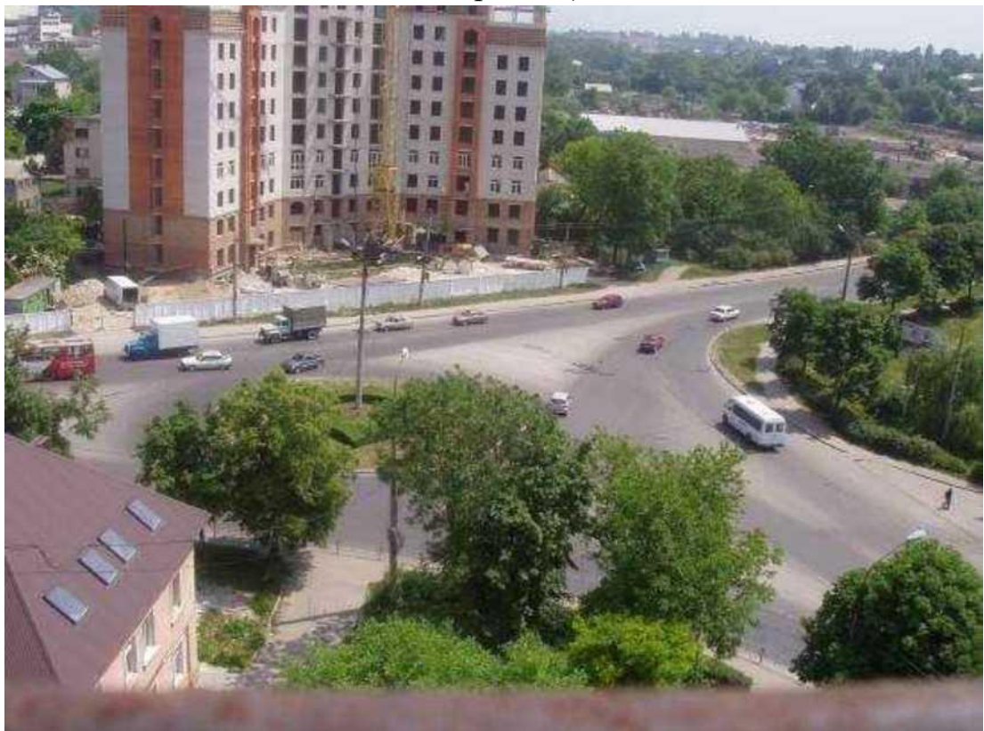
Транспортна розв'язка вулиць Микулинецька, Живова, Острозького, Замонастирська, Гайова у м. Тернопіль (стаціонарний пост спостереження за станом атмосферного повітря № 2)