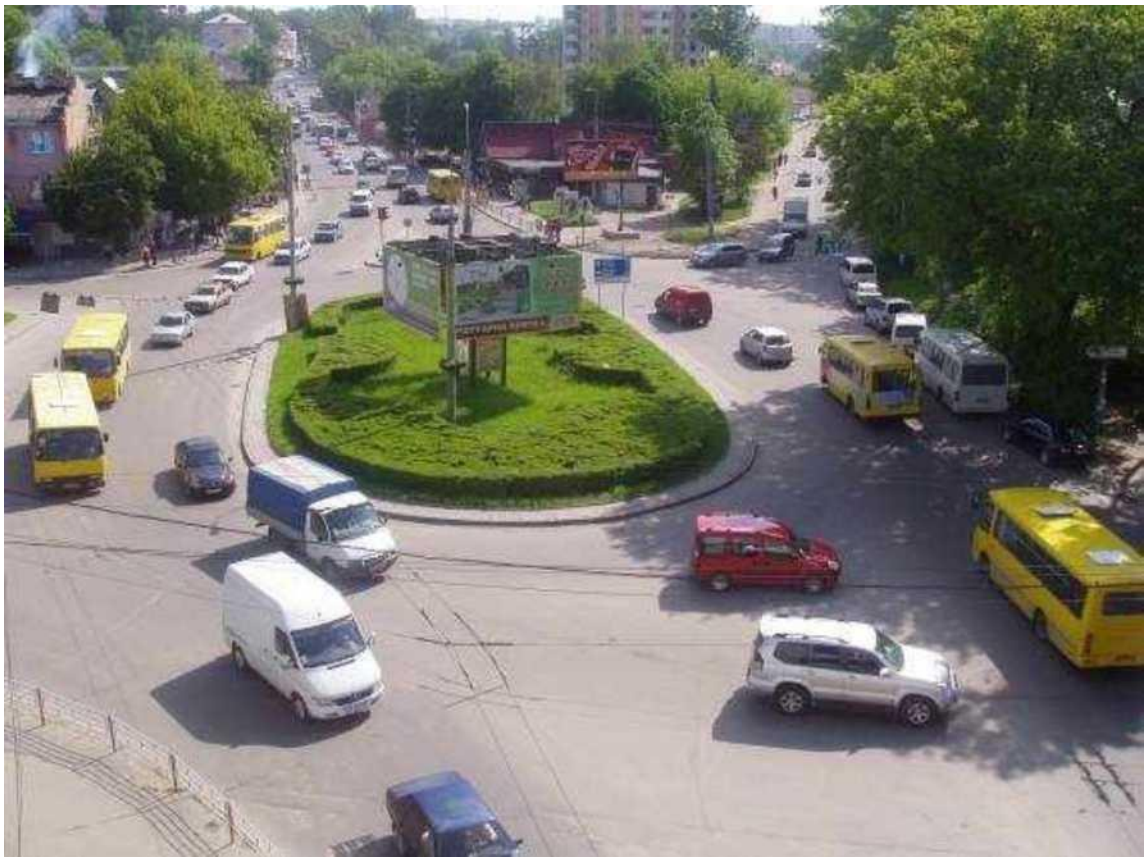
Транспортна розв'язка вулиць Збараської, Бродівської, Галицької у м. Тернопіль (стаціонарний пост спостереження за станом атмосферного повітря № 1)