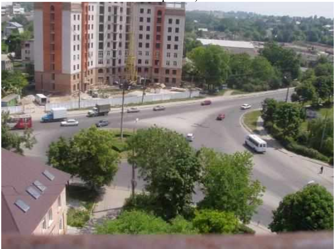
Транспортна розв'язка вулиць Микулинецька, Живова, Острозького, Замонастирська, Гайова у м. Тернопіль (стаціонарний пост спостереження за станом атмосферного повітря № 2)