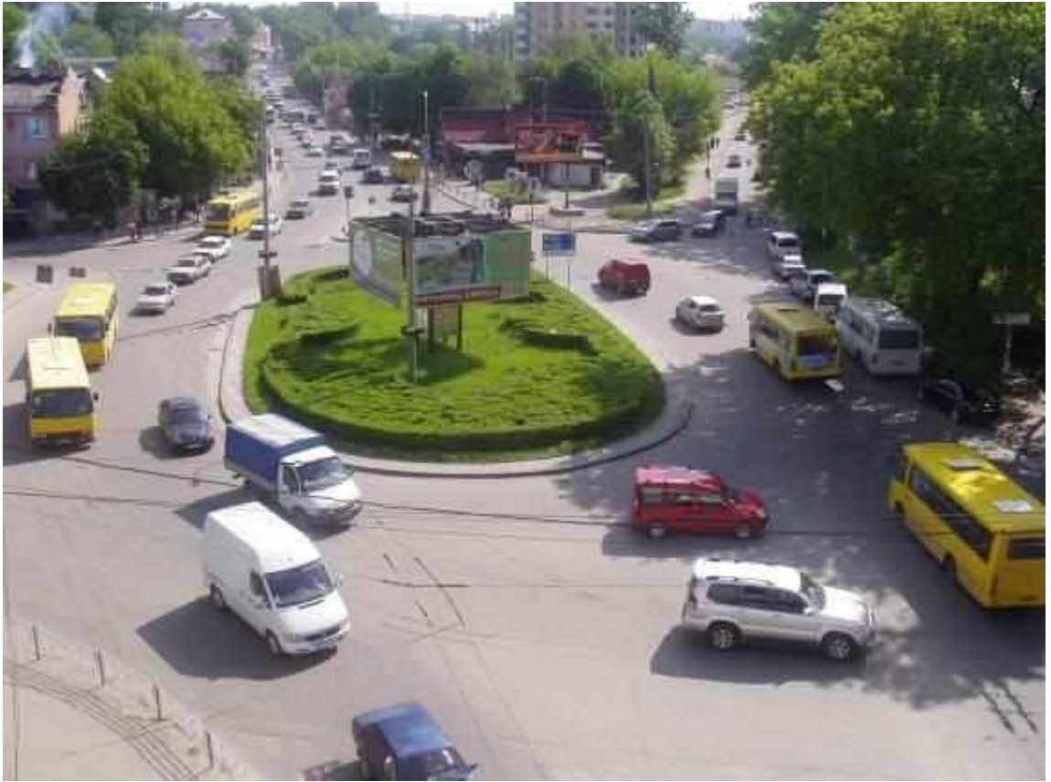
Транспортна розв'язка вулиць Збараської, Бродівської, Галицької у м. Тернопіль (стаціонарний пост спостереження за станом атмосферного повітря № 1)