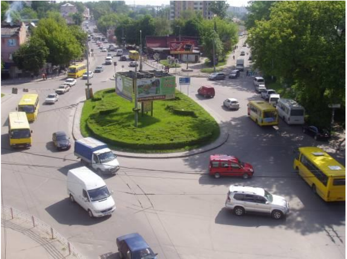
Транспортна розв'язка вулиць Збараської, Бродівської, Галицької у м. Тернопіль (стаціонарний пост спостереження за станом атмосферного повітря № 1)