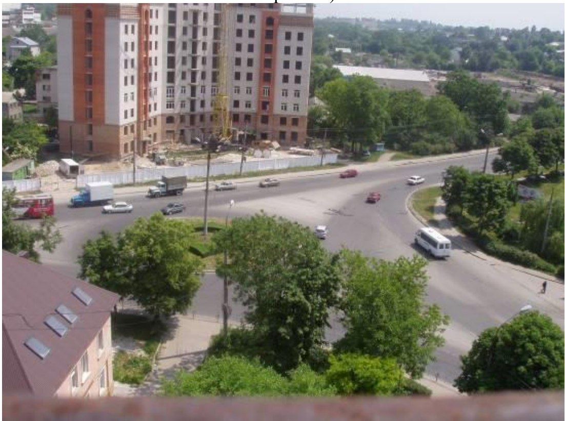
Транспортна розв'язка вулиць Микулинецька, Живова, Острозького, Замонастирська, Гайова у м. Тернопіль (стаціонарний пост спостереження за станом атмосферного повітря № 2)