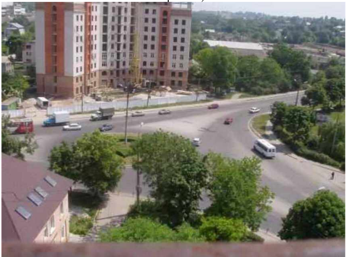
Транспортна розв'язка вулиць Микулинецька, Живова, Острозького, Замонастирська, Гайова у м. Тернопіль (стаціонарний пост спостереження за станом атмосферного повітря № 2)