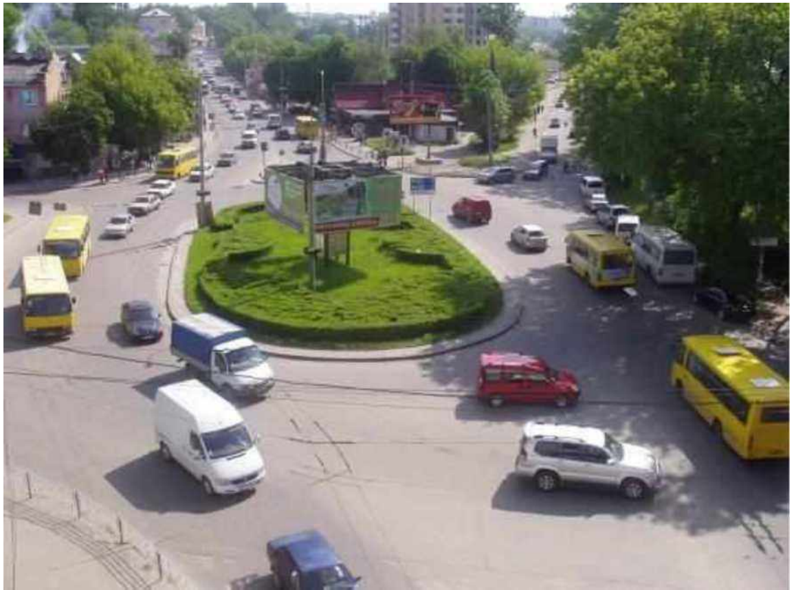
Транспортна розв'язка вулиць Збарзької, Бродівської, Галицької у м. Тернопіль (стаціонарний пост спостереження за станом атмосферного повітря № 1)