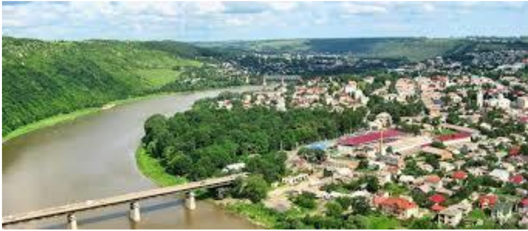
мал. 2.4. Річка Дністер місто Заліщики

Річка Нічлава відноситься до малих річок, є водним об'єктом господарсько-побутового призначення. Стік ріки (у верхній течії Нічлава) формується на території області. Забруднення спостерігається по всій течії річки. На якість вод особливо впливають зворотні води міста Борщів, де відсутні очисні споруди. Завдяки каскаду ставків на території міста, де відбувається самоочищення води, вплив міста зменшується. В нижній течії річка має високий вміст сульфатів, чим суттєво відрізняється від інших рік регіону.