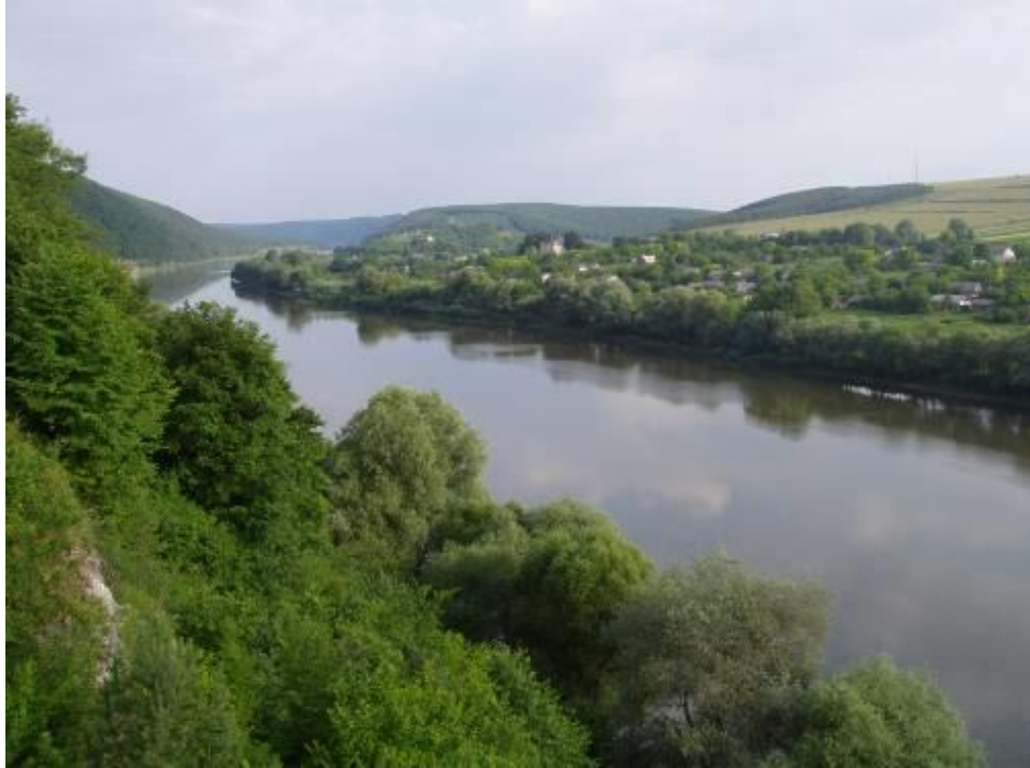
Мал.. 2.3. Касперівське водосховище на річці Серет

Контроль за станом р. Серет в районі Касперівського водосховища протягом січня не проводився.