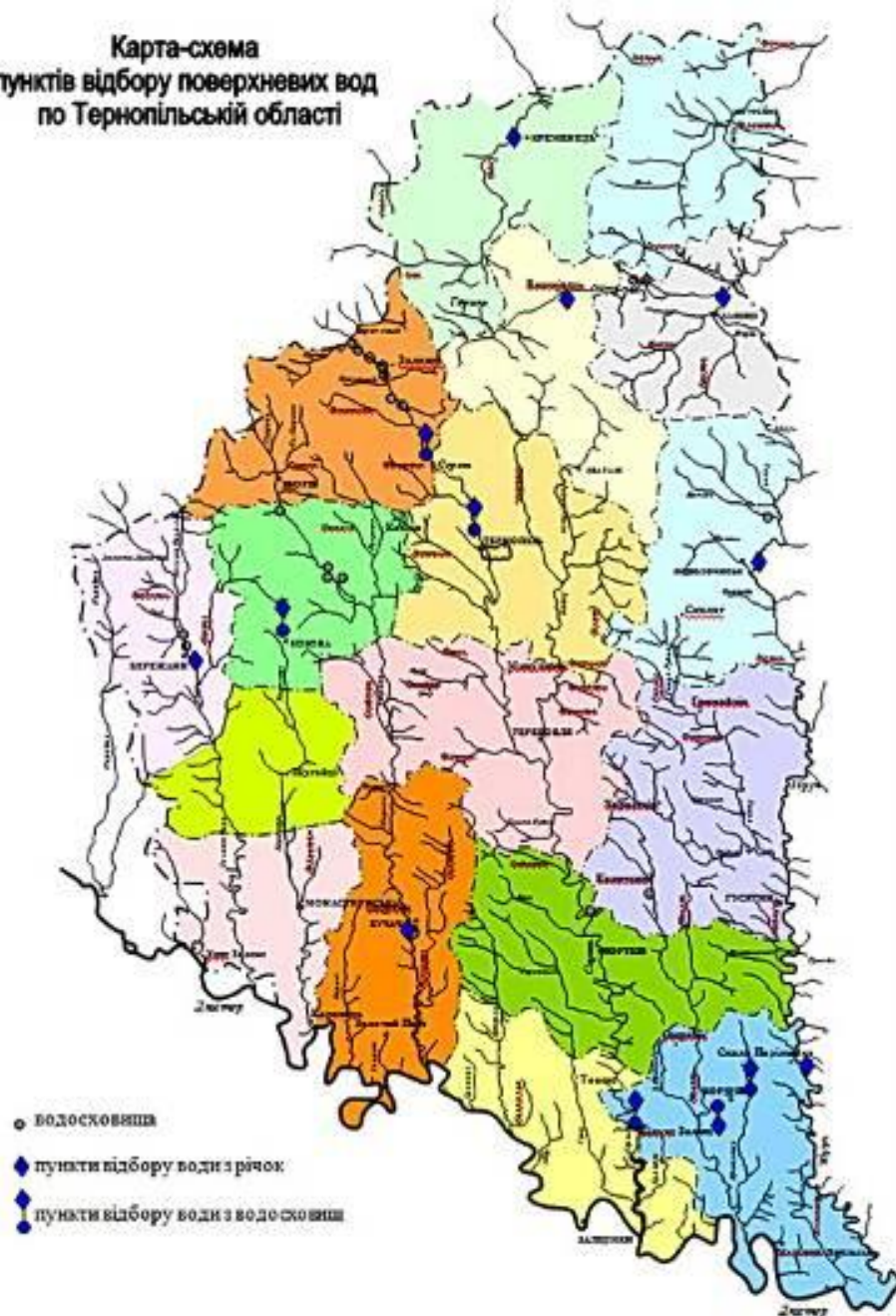
Карта-схема пунктів відбору поверхневих вод по Тернопільській області

Водний фонд області складається з поверхневих (річки, водосховища, ставки) і підземних вод. (табл.3)