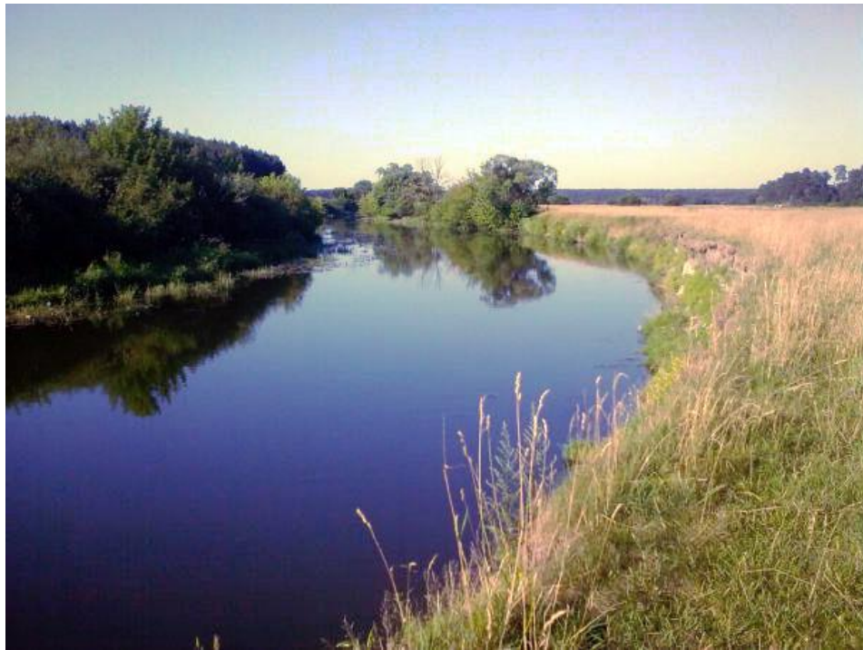
Мал. 2.6.Річка Горинь

Контроль за станом р. Горинь у створі, який знаходиться в м. Ланівці протягом січня не проводився.