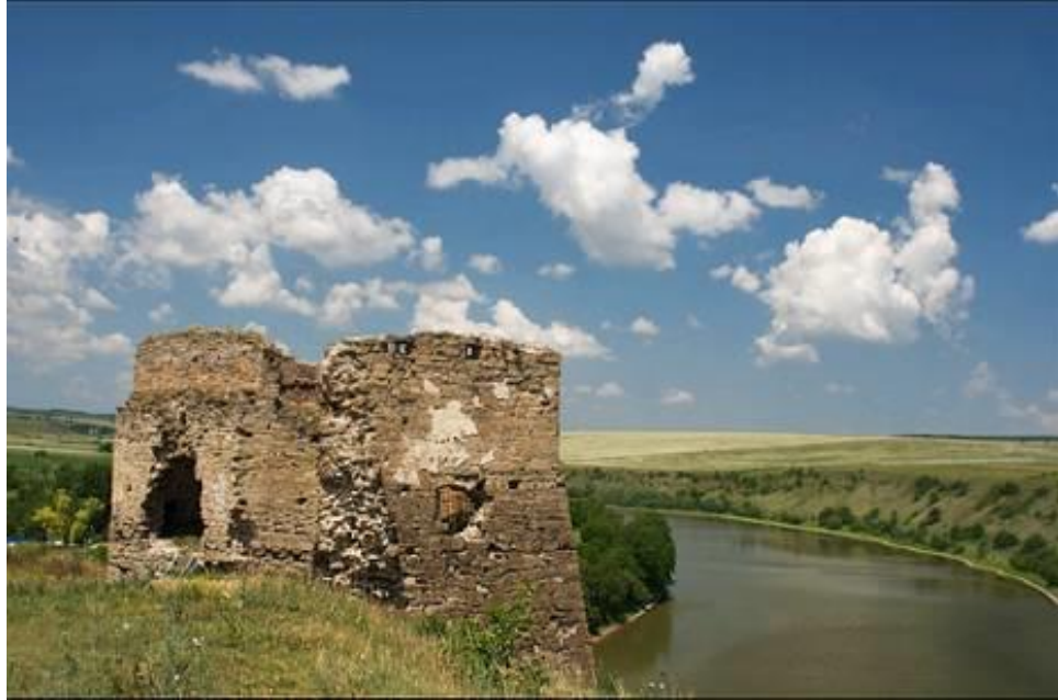
мал.2.5. Річка Збруч

Контроль за станом р. Збруч проводився 08 січня 2020 року в створі, який знаходиться смт Підволочиськ (водний об'єкт рибогосподарського призначення). При аналізі результатів виявлено перевищення ГДК по показнику ХСК ( 16,0 \text{ мгО}_2/\text{дм}^3 при ГДК 15,0 \text{ мгО}_2/\text{дм}^3 ), азот амонійний ( 0,569 \text{ мг}/\text{дм}^3 при ГДК 0,5 \text{ мг}/\text{дм}^3 ) марганцю ( 0,089 \text{ мг}/\text{дм}^3 при ГДК 0,01 \text{ мг}/\text{дм}^3 ), хром 0,002 \text{ мг}/\text{дм}^3 при ГДК 0,001 \text{ мг}/\text{дм}^3 ), залізо загальне ( 0,36 \text{ мг}/\text{дм}^3 при ГДК 0,1 \text{ мг}/\text{дм}^3 ) (для водних об'єктів рибогосподарського призначення).