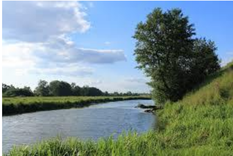
Мал. 2.7. Річка Іква

З 01.01.2017 року набрало чинності розпорядження Кабінету Міністрів України від 20.01.2016р. №94-р „Про визнання такими, що втратили чинність, та такими, що не застосовуються на території України, акти санітарного законодавства”, відповідно до якого втратили чинність акти санітарного законодавства, видані центральними органами виконавчої влади Української РСР, в тому числі їх посадовими особами, якими затверджено санітарні, санітарно-гігієнічні, санітарно-протиепідемічні, санітарно-епідеміологічні, протиепідемічні, гігієнічні правила і норми, державні санітарно-епідеміологічні нормативи та санітарні регламенти. Тому, у цій ситуації через відсутність затверджених Кабінетом Міністрів України нових санітарно-гігієнічних норм (ГДК) неможливо визначити ступінь вмісту забруднюючих речовин у поверхневих водоймах господарсько-побутового призначення.