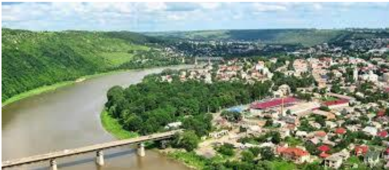
мал. 2.4. Річка Дністер місто Заліщики

довжина якого 700 км, середня ширина – 120 км. Режим ріки висвітлюється на водомірному посту в м.Заліщики, де водомірні спостереження ведуться з 1850 року. Основними елементами спостережень були рівні води і льодові явища. За характером гідрологічного режиму залежить від своїх приток – річок Карпатської зони і Поділля. Найбільше значення в режимі Дністра мають Карпатські притоки, які його й визначають.