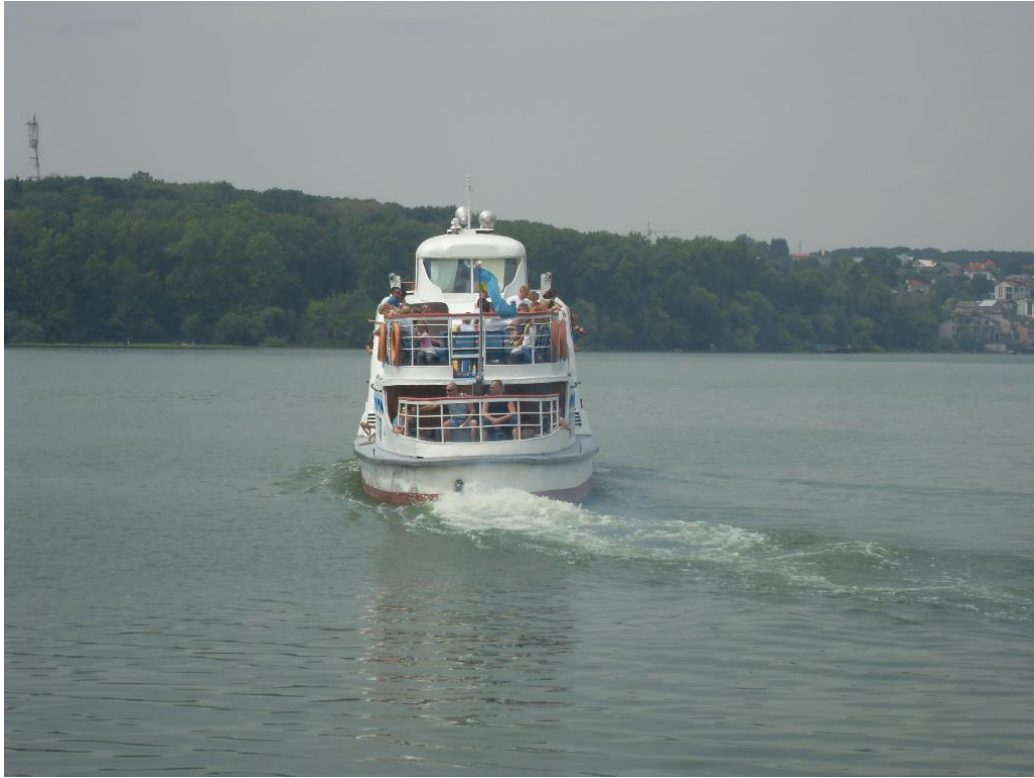
Мал. 2.1. Тернопільський став

Івачівське водосховище р. Серет відноситься до категорії господарсько-побутового призначення.