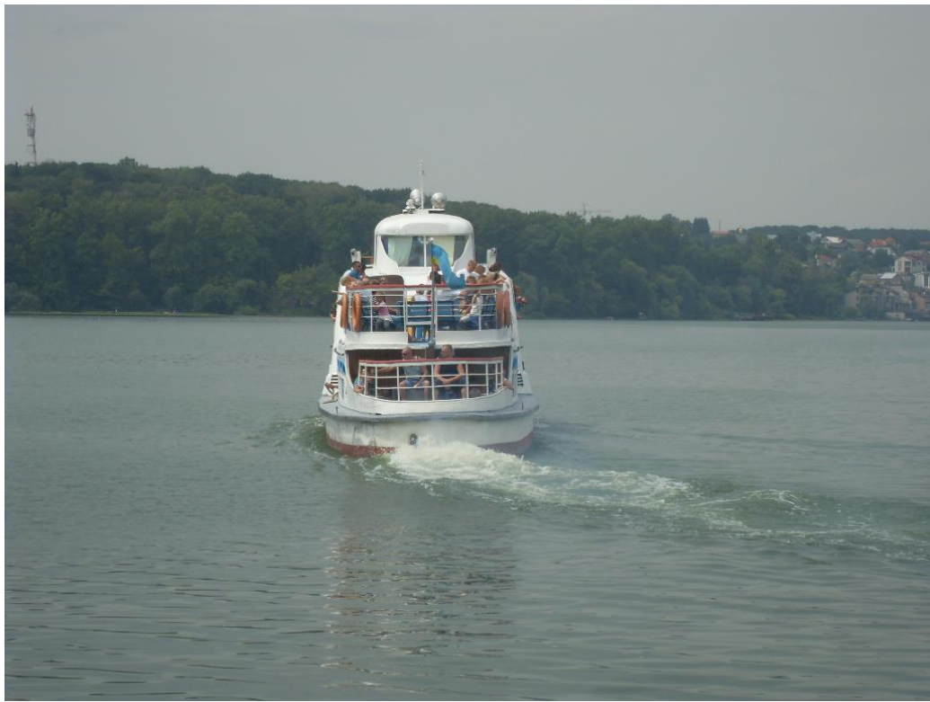
Мал. 2.1. Тернопільський став

Івачівське водосховище р. Серет відноситься до категорії господарсько-побутового призначення.