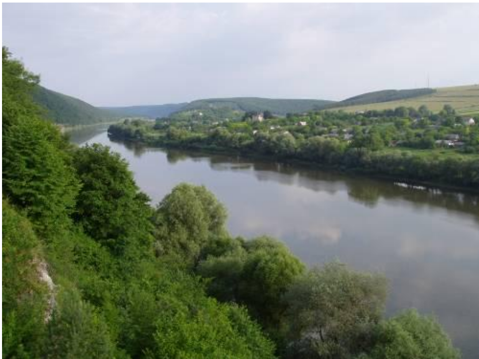
Мал.. 2.3. Касперівське водосховище на річці Серет

Контроль за станом р. Серет в районі Касперівського водосховища проводився 3 серпня 2018 року регіональним офісом водних ресурсів у Тернопільській області у створі в с. Касперівці 6 км (Касперівське водосховище).