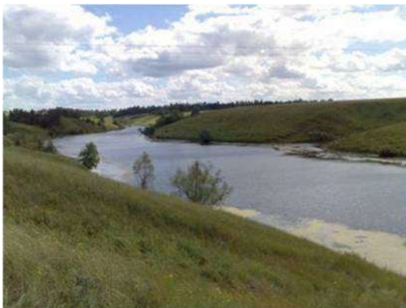
Мал.2.6. Річка Коропець

Контроль за станом р. Коропець протягом серпня не проводився.