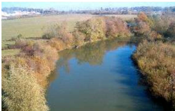
Мал. 2.5.Річка Горинь

Контроль за станом р. Горинь проводився 03 серпня 2017 року Тернопільським обласним управлінням водних ресурсів у створі, який знаходиться в смт. Вишнівець (водний об'єкт господарсько-побутового призначення).