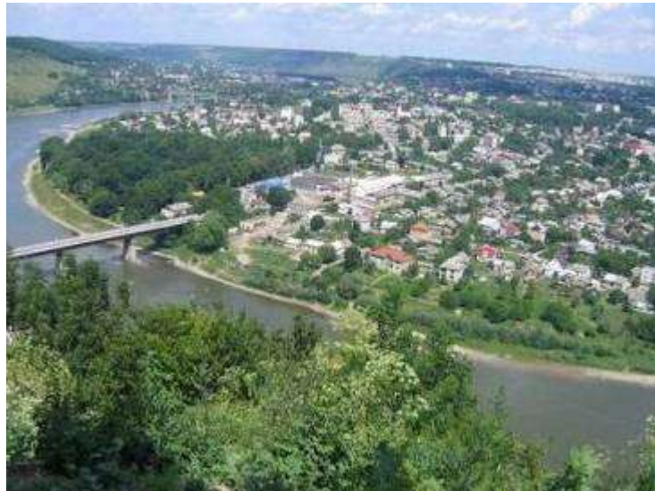
Річка Дністер місто Заліщики

Річка Дністер є другою за розмірами рікою України і головною водною артерією Молдови. Ріка починається в Карпатах на висоті 760 м над рівнем моря недалеко від села Вовче Турківського району Львівської області і тече спочатку на північ, а далі на південний схід через Західну Україну, Поділля. І вже недалеко від Одеси впадає у Чорне море, а точніше у Дністровський лиман. Традиційно Дністер поділяється на такі три частини: верхній (від витоків до гирла Золотої Липи), середній (від гирла Золотої Липи до гирла Реута недалеко від Дубоссар) і нижній (від гирла Реута до Дністровського лиману). Загальна довжина річки – 1352 км, площа водозабору – 72100 км 2 . Загальне падіння 759 м, середній нахил водної поверхні – 1,78%. У межах області Дністер має довжину 262 км. На схід від с.Нижнів Дністер є границею між Івано-Франківською і Тернопільською областями. Басейн Дністра має форму вигнутого посередині овалу, довжина якого 700 км, середня ширина – 120 км. Режим ріки висвітлюється на водомірному посту в м.Заліщики, де водомірні спостереження ведуться з 1850 року. Основними елементами спостережень були рівні води і льодові явища. За характером гідрологічного режиму залежить від своїх приток – річок Карпатської зони і Поділля. Найбільше значення в режимі Дністра мають Карпатські притоки, які його й визначають.