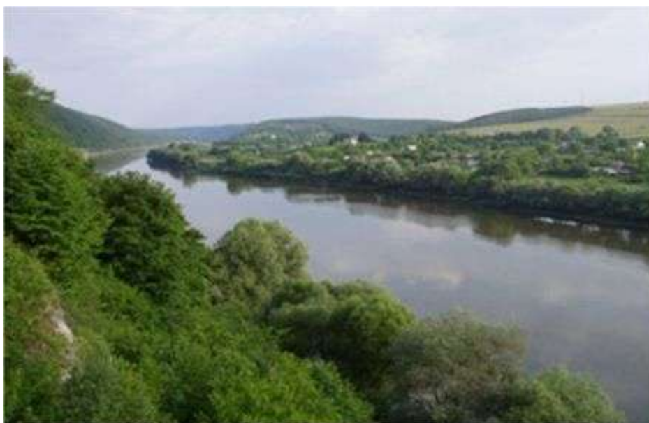
Мал.2.3. Касперівське водосховище на річці Серет

Контроль за станом р. Серет в районі Касперівського водосховища проводився 16 серпня 2017 року Тернопільським обласним управлінням водних ресурсів у створі в с. Касперівці 6 км (Касперівське водосховище).