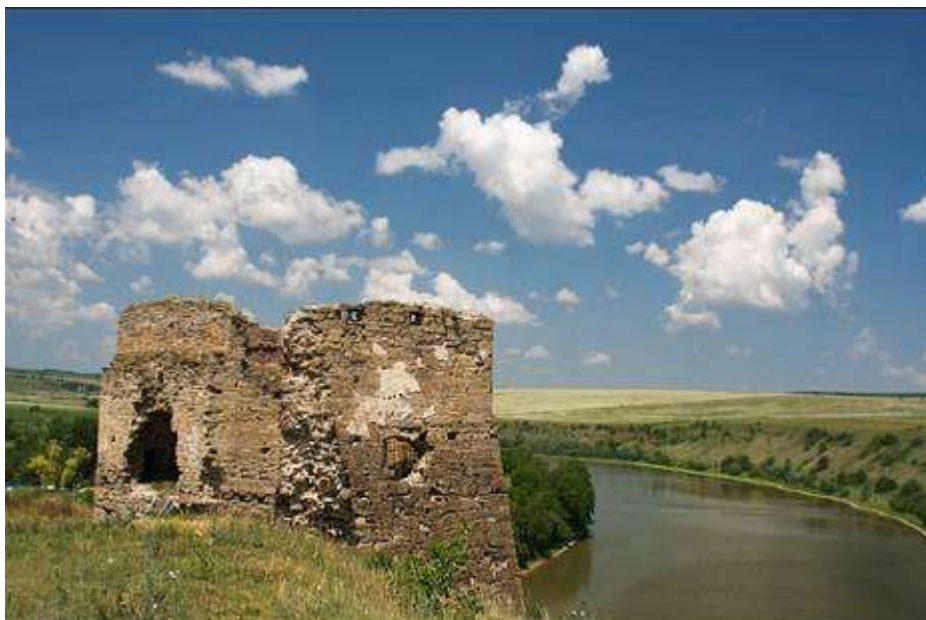
мал.2.8. Річка Збруч

Річка Циганка протікає в межах Борщівського району Тернопільської області, є водним об'єктом рибогосподарського призначення. Ліва притока Нічлави (басейн Дністра).