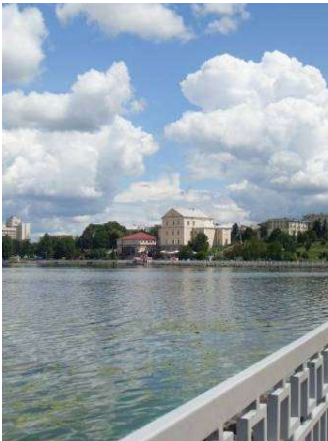
Мал. 2.2. Тернопільське водосховище

Касперівське водосховище, р. Серет – відноситься до категорії господарсько-побутового призначення.