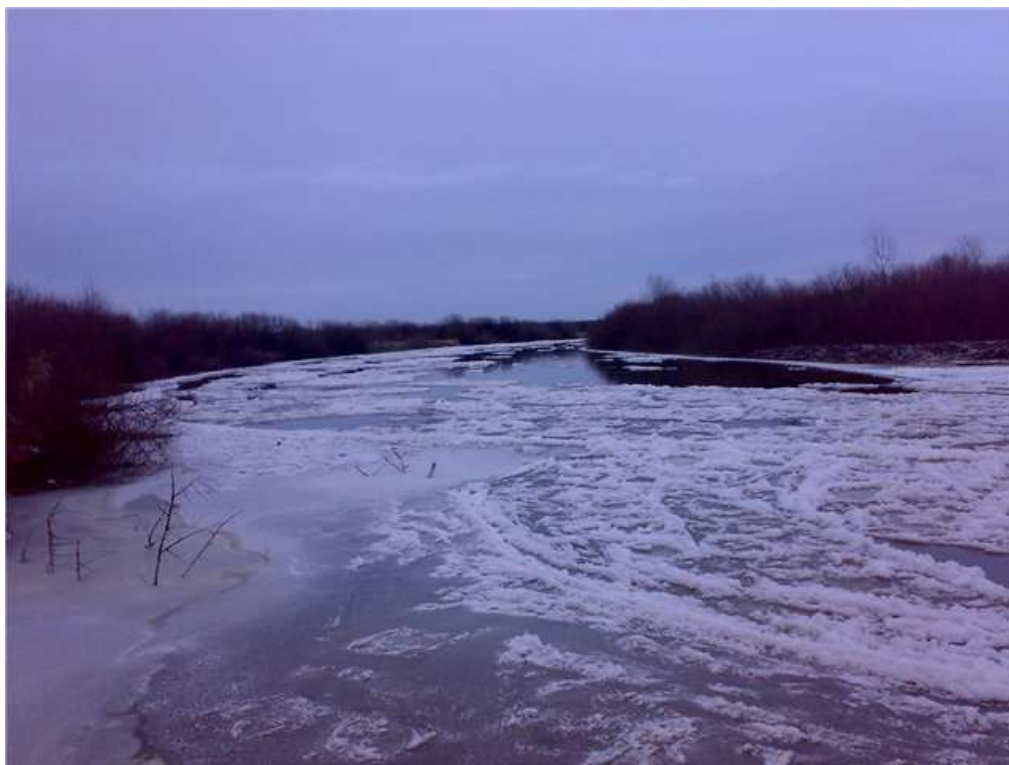
Мал. 2.5.Річка Горинь

Річка Іква відноситься до середніх річок, відноситься до басейну р.Прип'ять. Є водним об'єктом господарсько-побутового призначення.