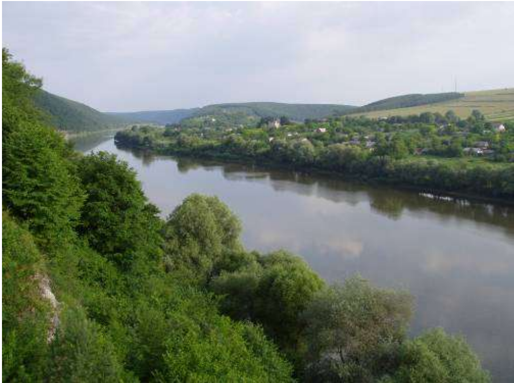
Мал. 2.2. Касперівське водосховище на річці Серет

Річка Дністер є другою за розмірами рікою України і головною водною артерією Молдови. Ріка починається в Карпатах на висоті 760 м над рівнем моря недалеко від села Вовче Турківського району Львівської області і тече спочатку на північ, а далі на південний схід через Західну Україну, Поділля. І вже недалеко від Одеси впадає у Чорне море, а точніше у Дністровський лиман. Традиційно Дністер поділяється на такі три частини: верхній (від витоків до гирла Золотої Липи), середній (від гирла Золотої Липи до гирла Реута недалеко від Дубоссар) і нижній (від гирла Реута до Дністровського лиману). Загальна довжина річки – 1352 км, площа водозабору – 72100м 2 . Загальне падіння 759 м, середній нахил водної поверхні – 1,78%. У межах області Дністер має довжину 262 км. На схід від с.Нижнів Дністер є границею між Івано-Франківською і Тернопільською областями, а від с. Зелений Гай Тернопільської області з Чернівецькою областю. Басейн Дністра має форму вигнутого посередині овалу, довжина якого 700 км, середня ширина – 120 км. Режим ріки висвітлюється на водомірному посту в м.Заліщики, де водомірні спостереження ведуться з 1850 року. Основними елементами спостережень були рівні води і льодові явища. За характером гідрологічного режиму залежить від своїх приток – річок Карпатської зони і Поділля. Найбільше значення в режимі Дністра мають Карпатські притоки, які його й визначають.