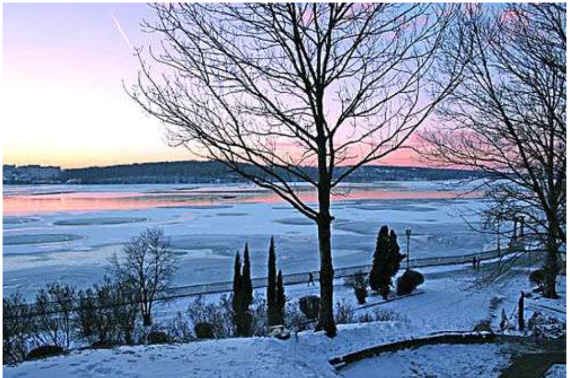
Мал. 2.1. Тернопільський став

Контроль за станом р. Серет Тернопільського водосховища проводився 15 лютого 2018 року Тернопільським обласним управлінням водних ресурсів від створу, який знаходиться в м.Тернопіль 180 км (Тернопільське водосховище).