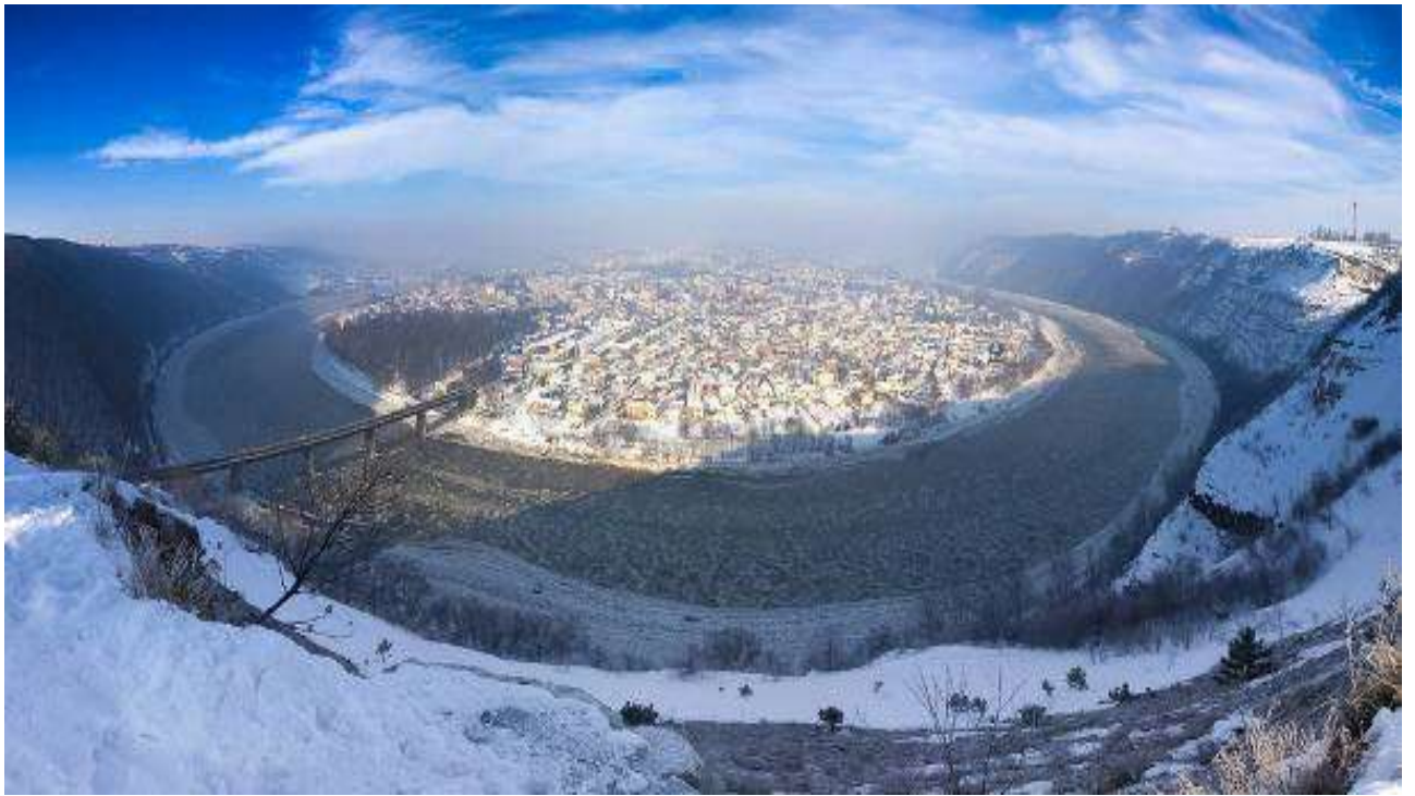
мал. 2.3. Річка Дністер місто Заліщики

Річка Нічлава відноситься до малих річок, є водним об'єктом господарсько-побутового призначення. Стік ріки (у верхній течії Нічлавка) формується на території області. Забруднення спостерігається по всій течії річки. На якість вод особливо впливають зворотні води міста Борщів, де відсутні очисні споруди. Завдяки каскаду ставків на території міста, де відбувається самоочищення води, вплив міста зменшується. В нижній течії річка має високий вміст сульфатів, чим суттєво відрізняється від інших рік регіону.