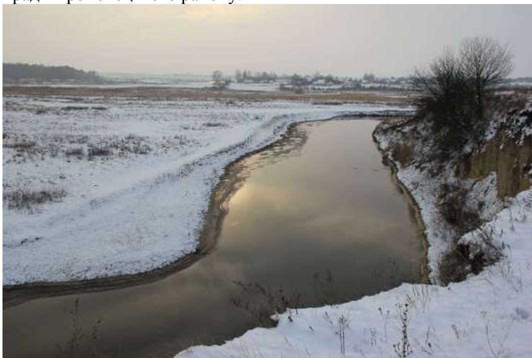
Мал. 2.6. Річка Іква

Контроль за станом р. Іква проводився 2 лютого 2018 року Тернопільським обласним управлінням водних ресурсів у створі, який знаходиться в м. Кременець та у створі який знаходиться у с.Андруга Білокриницької сільської ради Кременецького району.