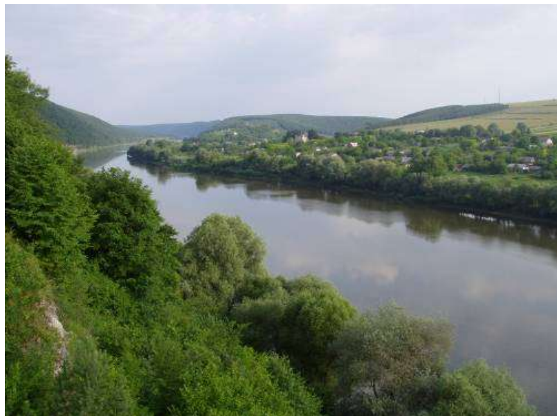
Мал.. 2.2. Касперівське водосховище на річці Серет

Контроль за станом р. Серет в районі Касперівського водосховища протягом квітня не проводився.