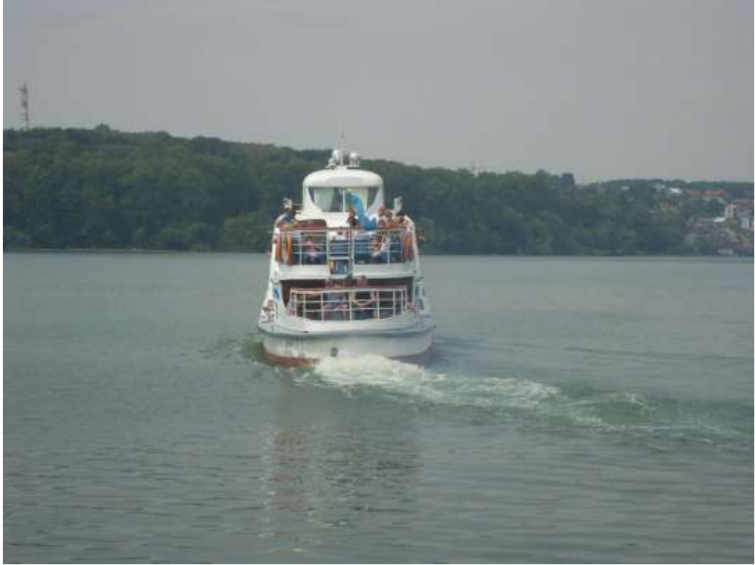
Мал. 2.1. Тернопільський став

Івачівське водосховище р. Серет відноситься до категорії господарсько-побутового призначення.