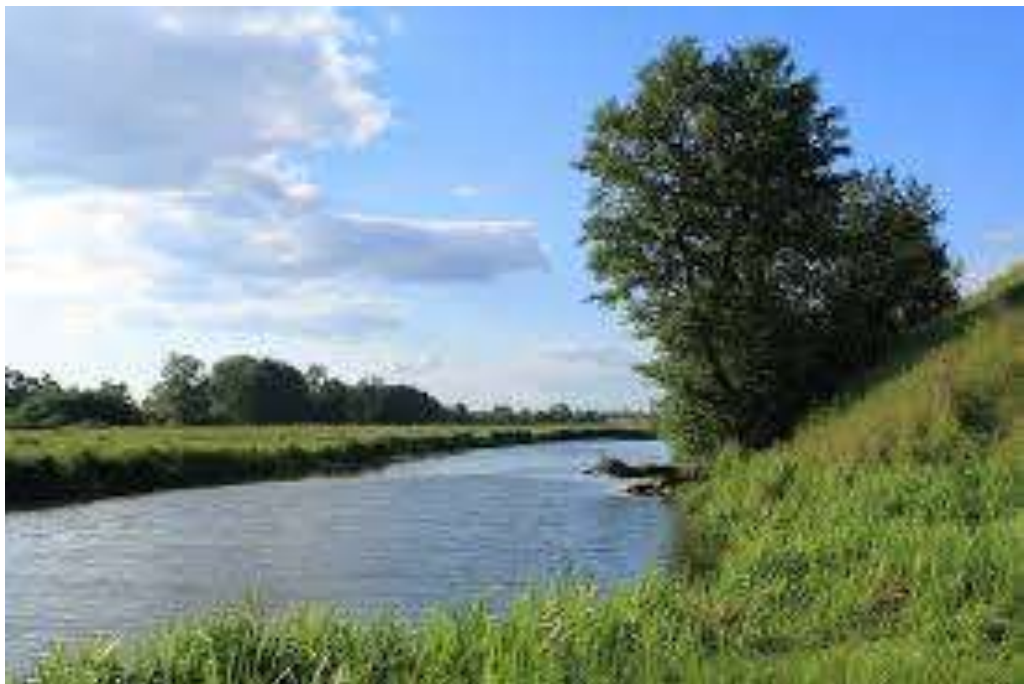
Мал. 2.6. Річка Іква

Річка Іква відноситься до середніх річок, відноситься до басейну р.Прип'ять. Є водним об'єктом господарсько-побутового призначення. Контроль за станом р. Іква протягом квітня не проводився.