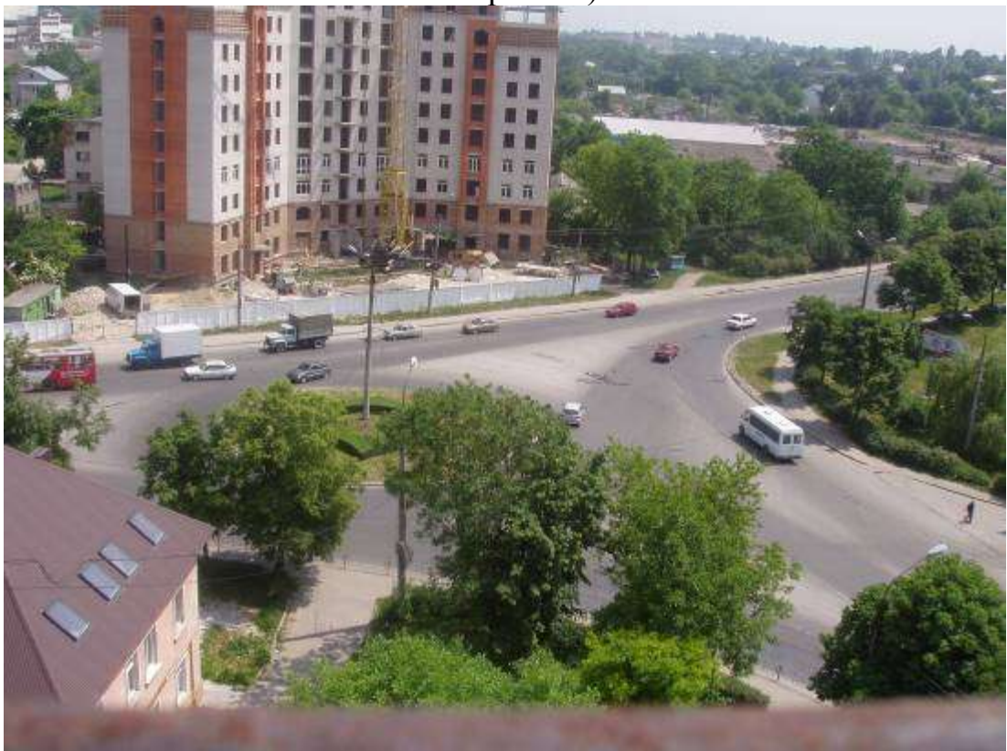
Транспортна розв'язка вулиць Микулинецька, Живова, Острозького, Замонастирська, Гайова у м. Тернопіль (стаціонарний пост спостереження за станом атмосферного повітря № 2)