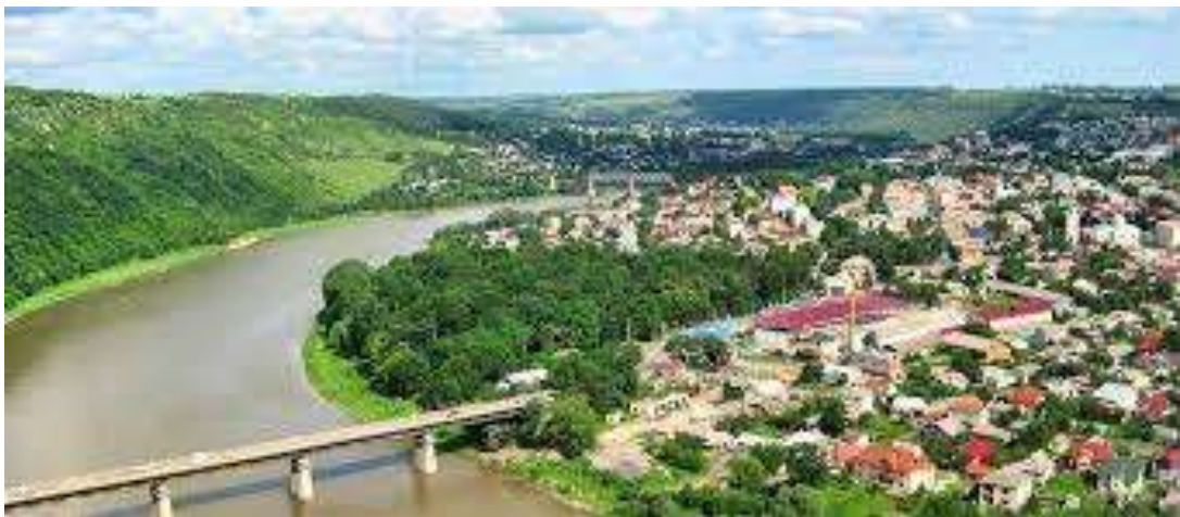
мал. 2.3. Річка Дністер місто Заліщики

Річка Дністер є другою за розмірами рікою України і головною водною артерією Молдови. Ріка починається в Карпатах на висоті 760 м над рівнем моря недалеко від села Вовче Турківського району Львівської області і тече спочатку на північ, а далі на південний схід через Західну Україну, Поділля. І вже недалеко від Одеси впадає у Чорне море, а точніше у Дністровський лиман. Традиційно Дністер поділяється на такі три частини: верхній (від витоків до гирла Золотої Липи), середній (від гирла Золотої Липи до гирла Реута недалеко від Дубоссар) і нижній (від гирла Реута до Дністровського лиману). Загальна довжина річки – 1352 км, площа водозабору – 72100м 2 . Загальне падіння 759 м, середній нахил водної поверхні – 1,78%. У межах області Дністер має довжину 262 км. На схід від с.Нижнів Дністер є границею між Івано-Франківською і Тернопільською областями, а від с. Зелений Гай Тернопільської області з Чернівецькою областю. Басейн Дністра має форму вигнутого посередині овалу, довжина якого 700 км, середня ширина – 120 км. Режим ріки висвітлюється на водомірному посту в м.Заліщики, де водомірні спостереження ведуться з 1850 року. Основними елементами спостережень були рівні води і льодові явища. За характером гідрологічного режиму залежить від своїх приток – річок Карпатської зони і Поділля. Найбільше значення в режимі Дністра мають Карпатські притоки, які його й визначають.