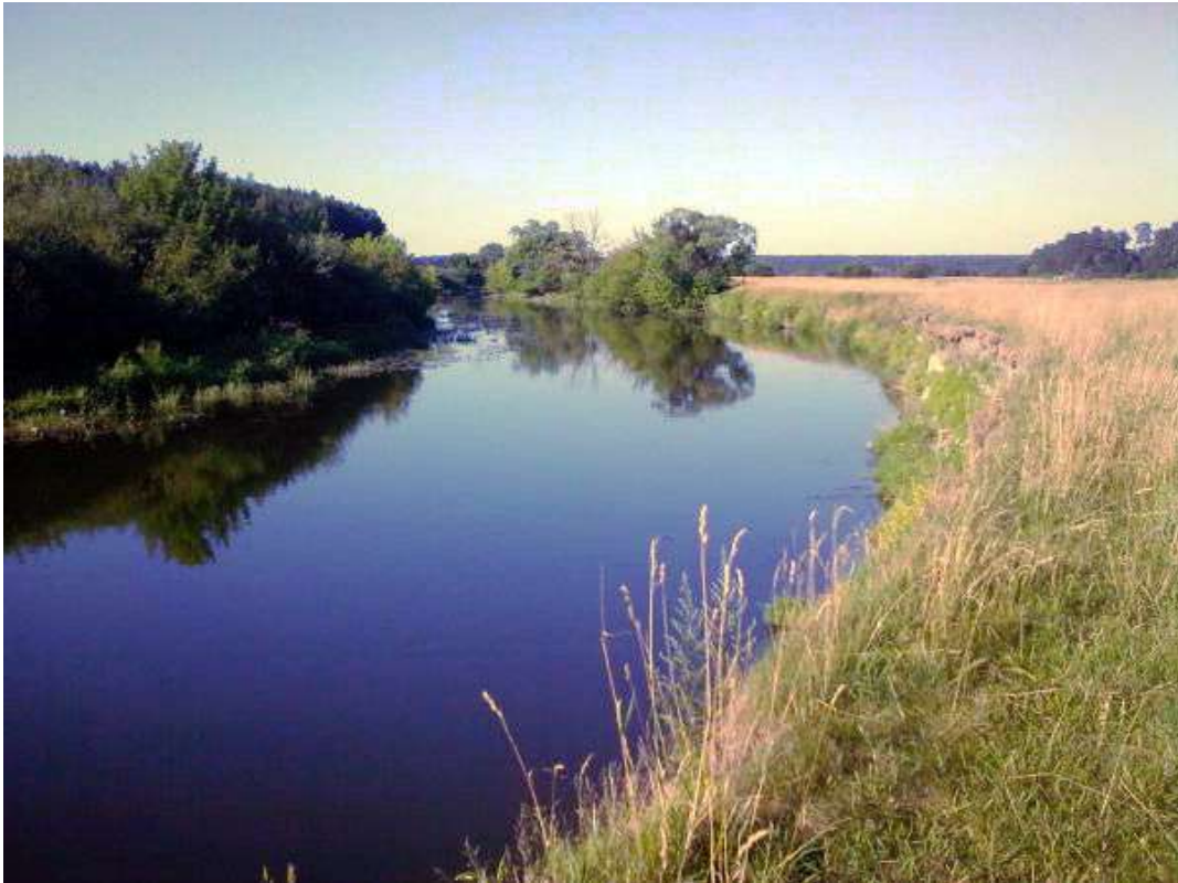
Мал. 2.5.Річка Горинь

Річка Іква відноситься до середніх річок, відноситься до басейну р.Прип'ять. Є водним об'єктом господарсько-побутового призначення. Контроль за станом р. Іква протягом квітня не проводився.