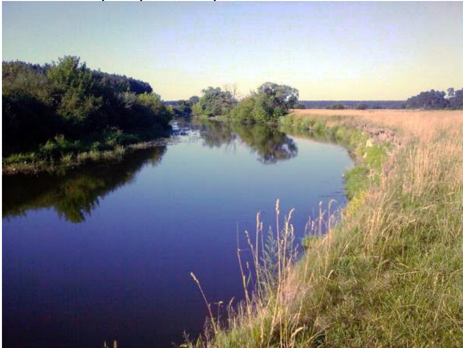
Мал. 2.6. Річка Горинь

Контроль за станом р. Горинь не проводиться.