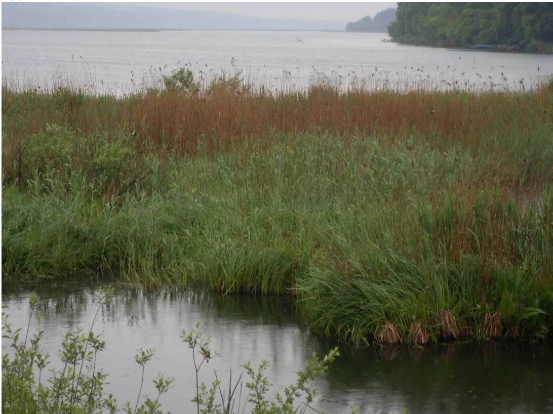
Мал.2.2 Івачівське водосховище

Контроль за станом р. Серет Івачівського водосховища протягом жовтня не проводився.