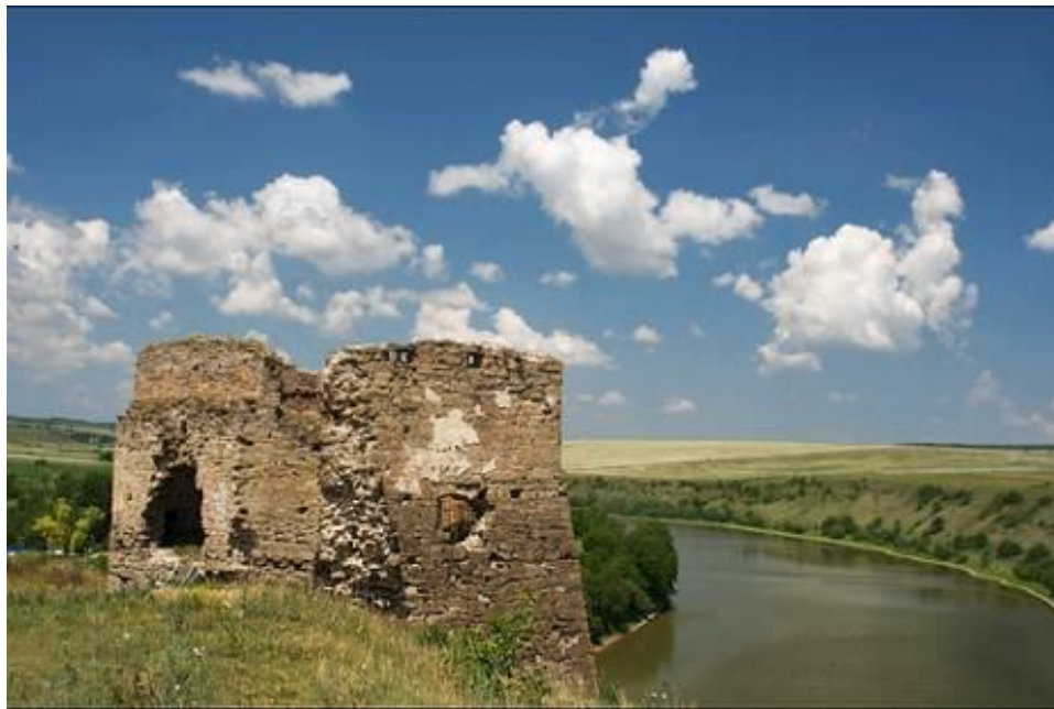
мал.2.5. Річка Збруч

Контроль за станом р. Збруч у створі який знаходиться в смт Підволочиськ протягом жовтня не проводився.