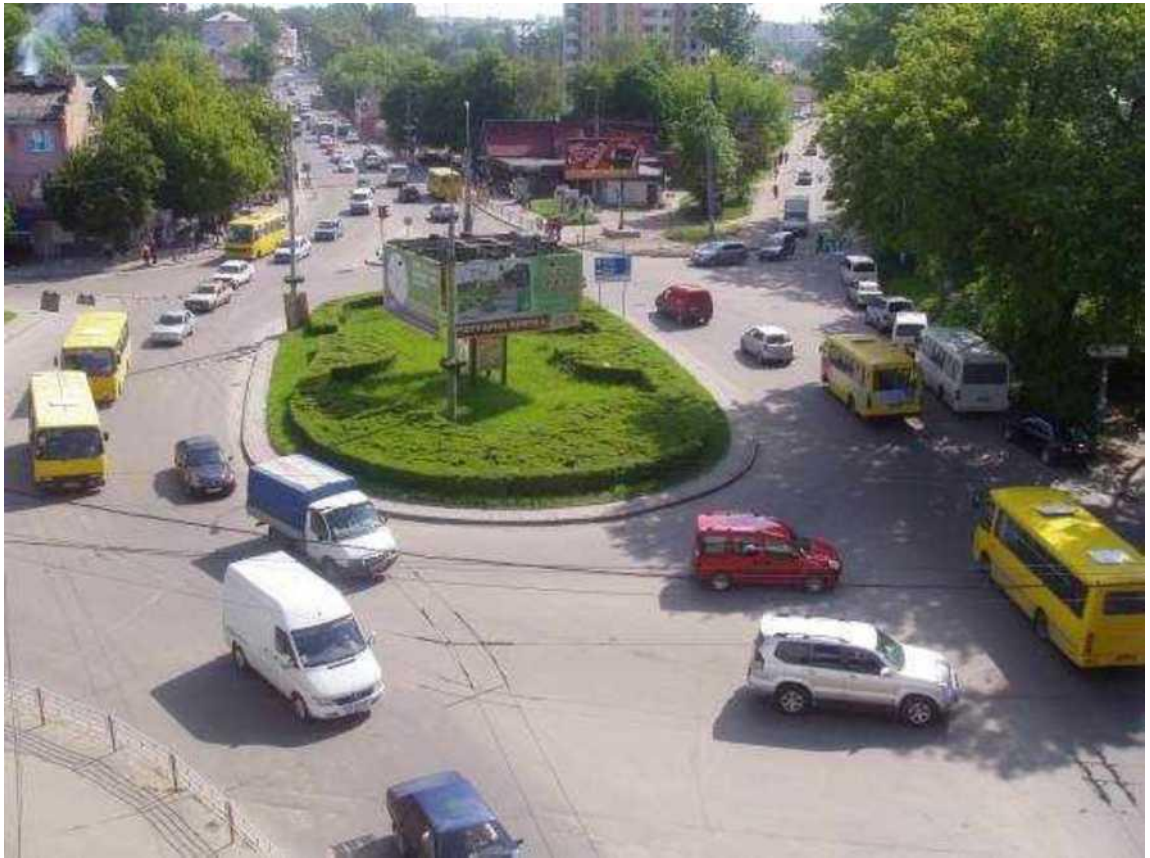
Транспортна розв'язка вулиць Збараської, Бродівської, Галицької у м. Тернопіль (стаціонарний пост спостереження за станом атмосферного повітря № 1)