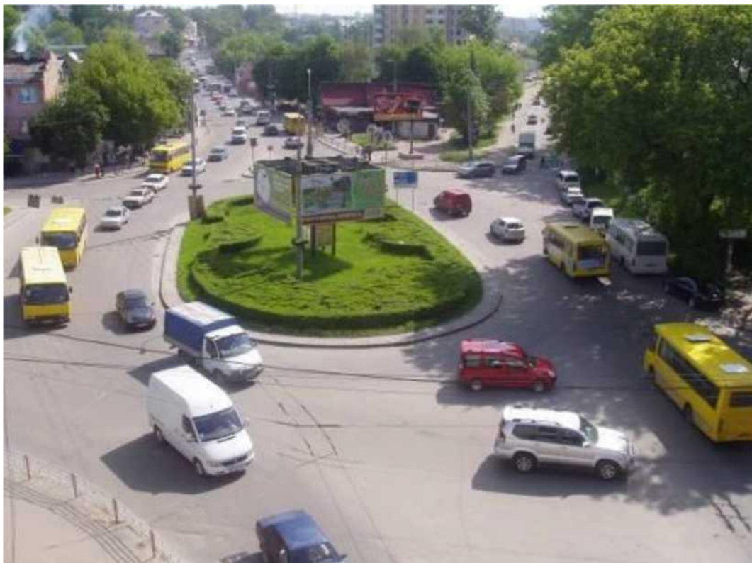
Транспортна розв'язка вулиць Збарзької, Бродівської, Галицької у м. Тернопіль (стаціонарний пост спостереження за станом атмосферного повітря № 1)