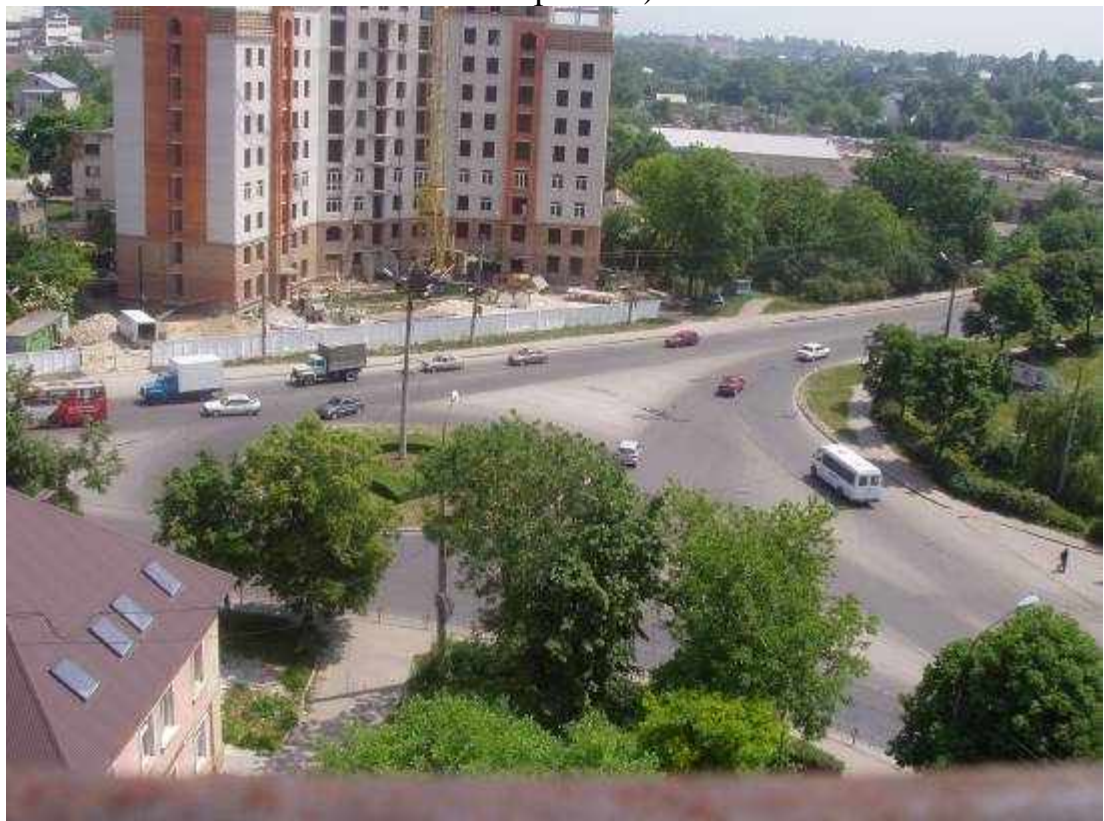
Транспортна розв'язка вулиць Микулинецька, Живова, Острозького, Замонастирська, Гайова у м. Тернопіль (стаціонарний пост спостереження за станом атмосферного повітря № 2)