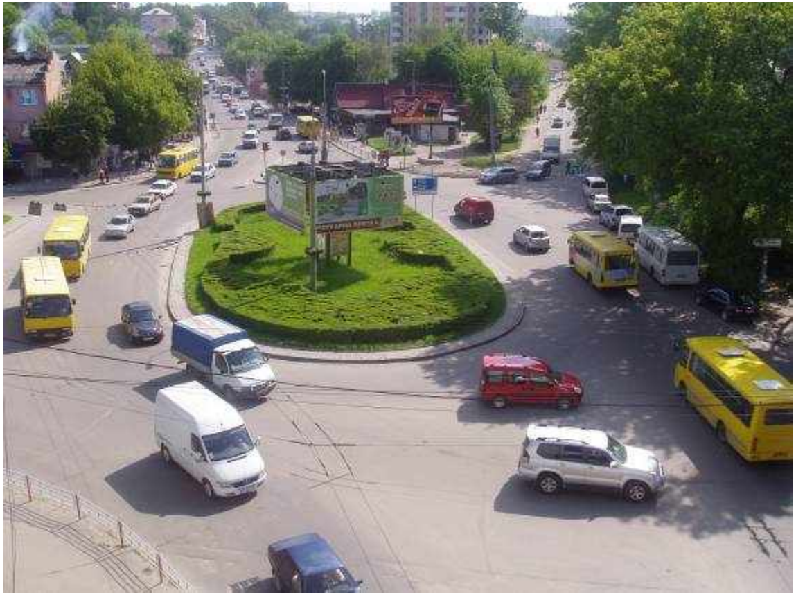
Транспортна розв'язка вулиць Збарзької, Бродівської, Галицької у м. Тернопіль (стаціонарний пост спостереження за станом атмосферного повітря № 1)