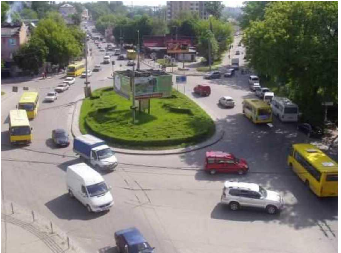
Транспортна розв'язка вулиць Збараської, Бродівської, Галицької у м. Тернопіль (стаціонарний пост спостереження за станом атмосферного повітря № 1)